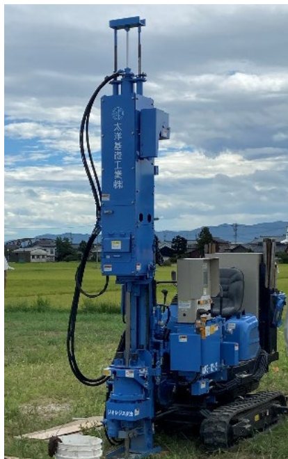
動的コーン貫入試験機(大型)

その他、液状化調査や一般的な土質調査（N値、地層構成、地下水位他）にも利用できます。