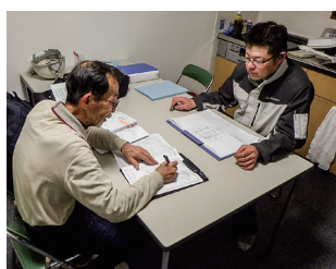
▲配筋検査の書類確認中