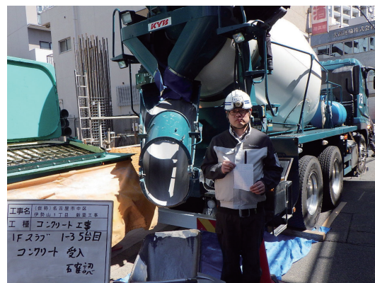
▲コンクリート受入確認