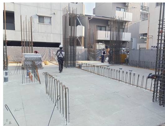
▲1床コンクリート打設完了後

現場は前面道路が狭く、一方通行の場所にある狭小な敷地。敷地境界線から建物までの距離が非常に近く、外部足場が越境してしまうという特徴があります。また、14階建て全39戸の共同住宅ですが、ワンフロア3戸のレイアウトがすべて異なる点も、この建物の特徴です。