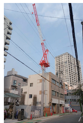
▲タワークレーン組立完了

個人的な取り組みとして、現場の注意事項やルールをAIに入力して新規入場者教育用の動画を作成し、現場で活用しています。動画にすることで、言葉だけでなく視覚的にもわかりやすく説明できるようになりました。また、外国籍の技能実習生も多いため、AIによる多言語への翻訳機能は非常に役立っています。AIの活用で時間を短縮し、図面や現場の確認といった本来の業務に時間を割けるようになり、タイムパフォーマンスの向上にもつながっています。