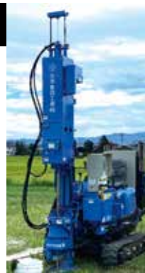
動的コーン 貫入試験機(大型)

軟弱地盤処理工における品質・出来形管理において、施工直後に動的コーン貫入試験と電気検層を同時に実施し、早期に改良強度・範囲を推定することで品質・出来形管理をする技術です。これにより、改良の不備や、それ以降の施工仕様の変更等につながる有益な情報を得ることができ、地盤改良の施工におけるリスク低減を図ることができます。その他、液状化調査や一般的な土質調査（N値、地層構成、地下水位他）にも利用できます。