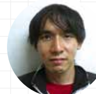
静岡支店 環境開発部 Aさん