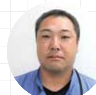
長野支店 工事部 Uさん